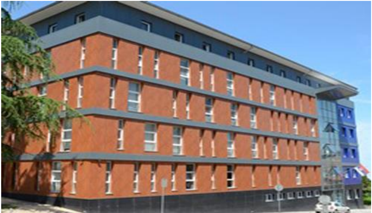
Лозница, ул.Јована Цвијића бб, ОЈТ у Лозници - пети спрат