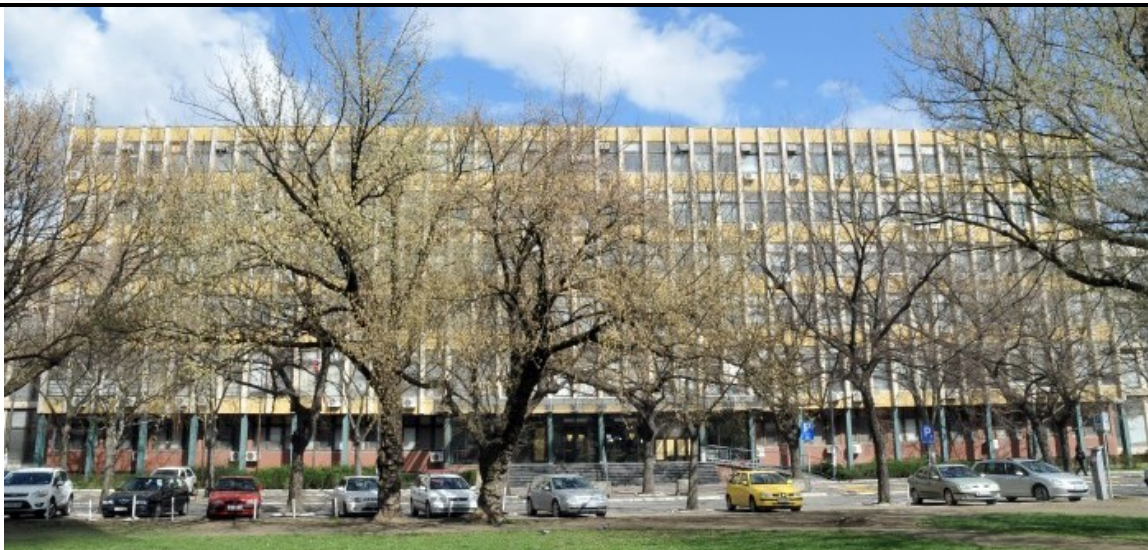
slika 1 - Zgrada pravosudnih organa u Novom Sadu u kojoj se nalazi Više javno tužilaštvo u Novom Sadu