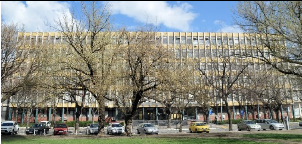
slika 1 - Zgrada pravosudnih organa u Novom Sadu u kojoj se nalazi Više javno tužilaštvo u Novom Sadu