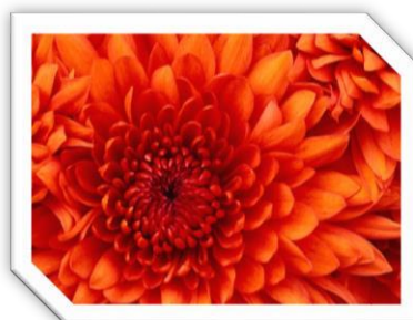
Slika 1: Cvet

(Dodati sliku u tekst, smanjiti je na proizvoljne dimenzije, tako da slika ne prelazi na drugu stranicu. Postaviti stil (okvir) po izboru.)